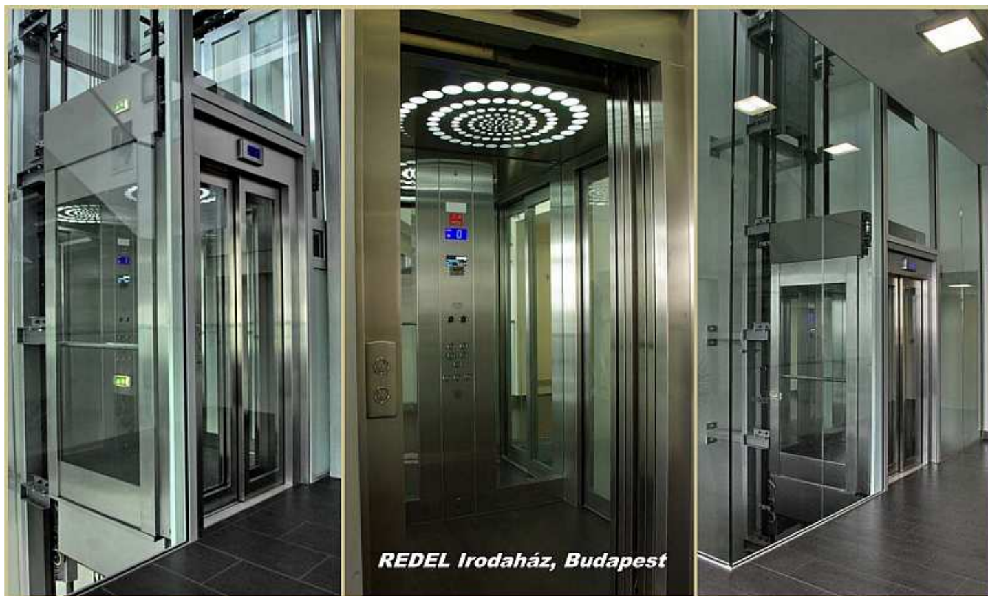
2-es számú pályázat