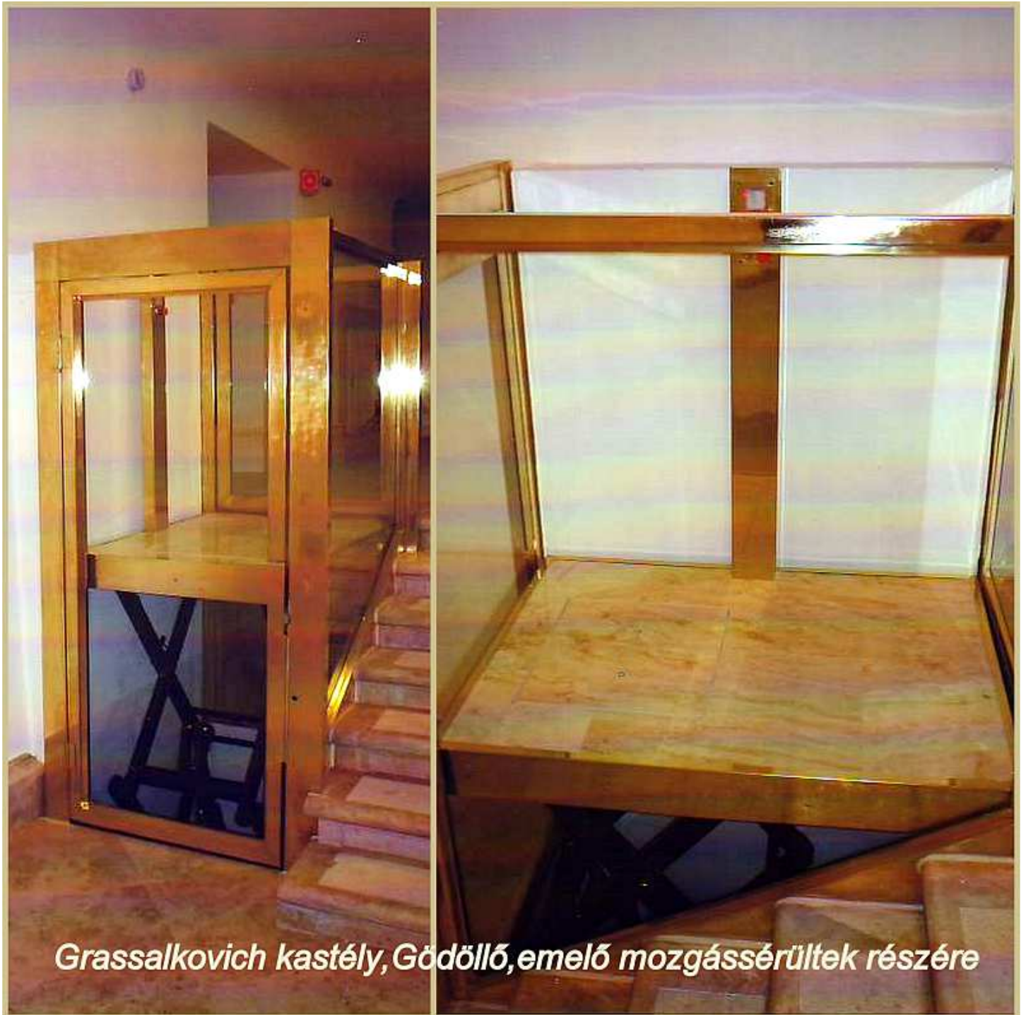
3-as számú pályázat