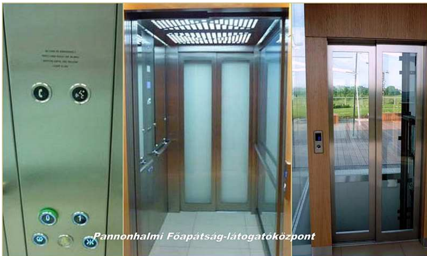
1-es számú pályázat