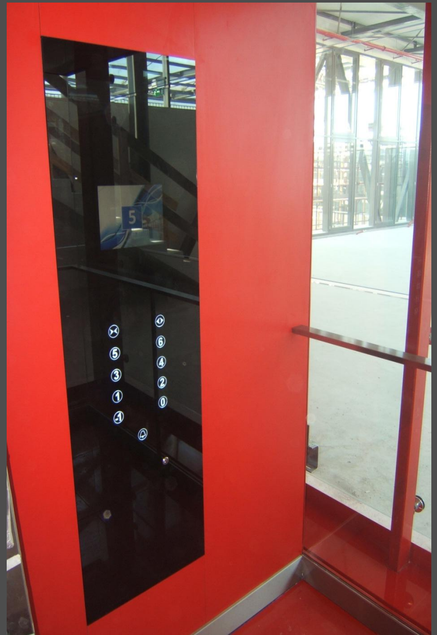
Deák Ferenc utca 3-5, Budapest