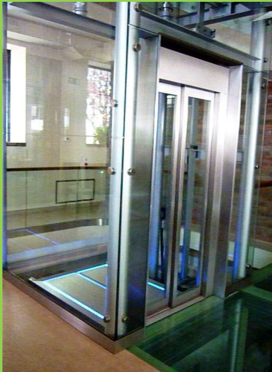
Békési Pálinka Zrt- Békés