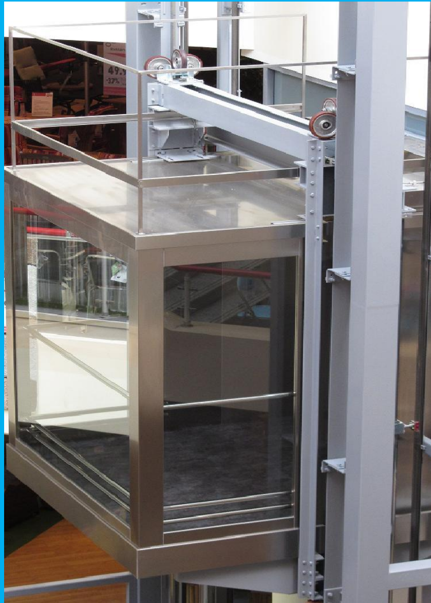
KIKA áruház Bp. Lehel út 51