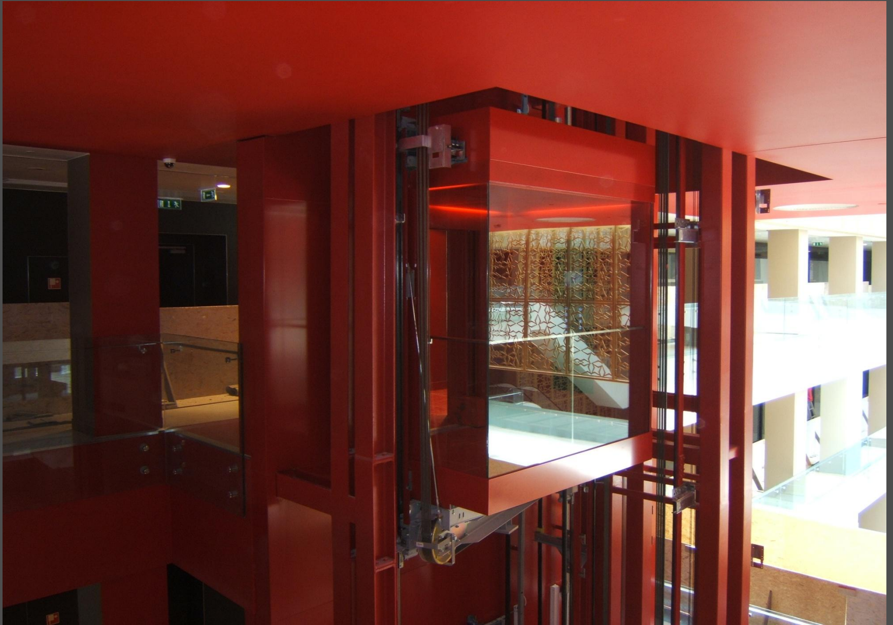
Deák Ferenc utca 3-5, Budapest