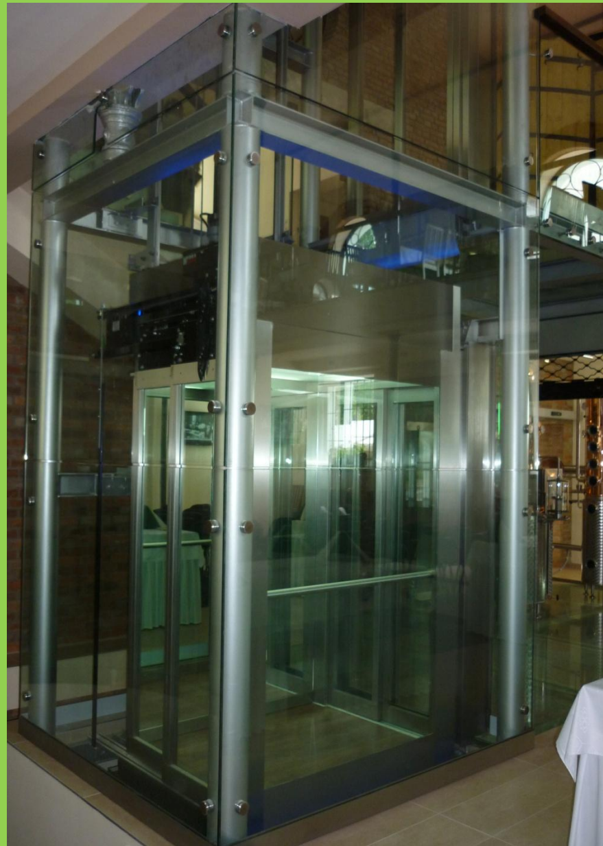
Békési Pálinka Zrt- Békés