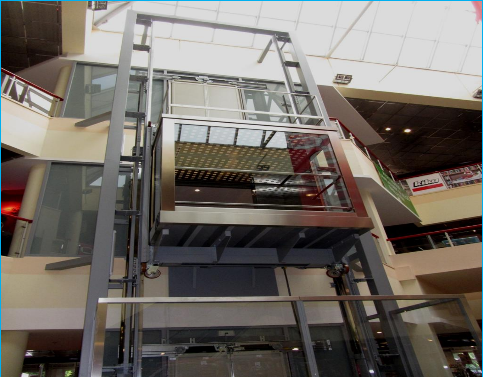
KIKA áruház Bp. Lehel út 51