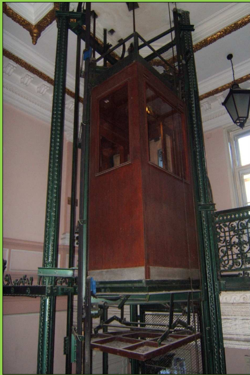
Felújítás előtti állapot