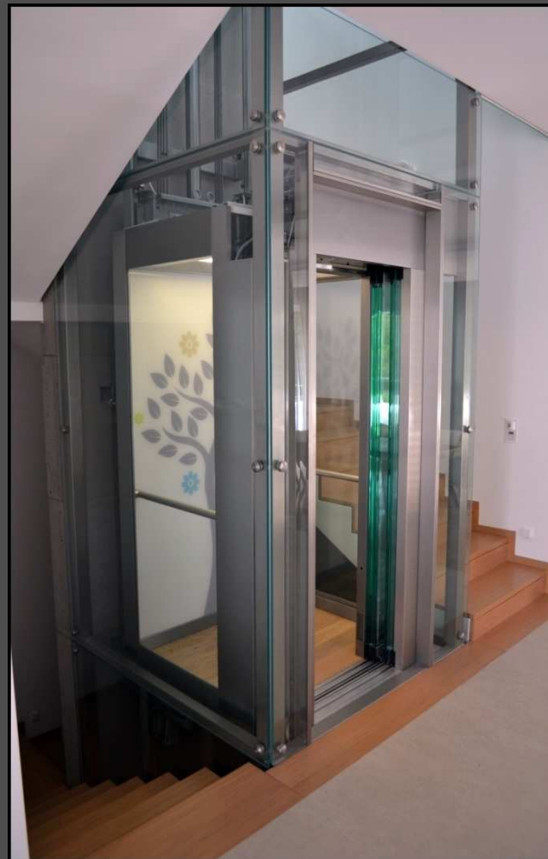
Budapest. II. Rézsű utca