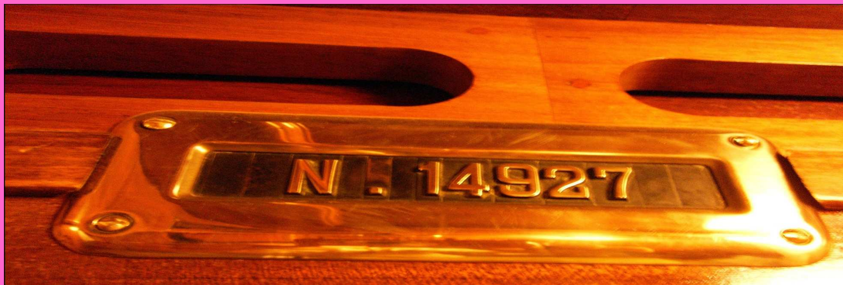
Fülke részletek táblákkal