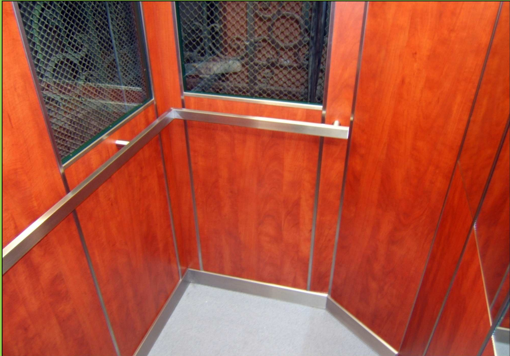
Felújítás utáni állapot