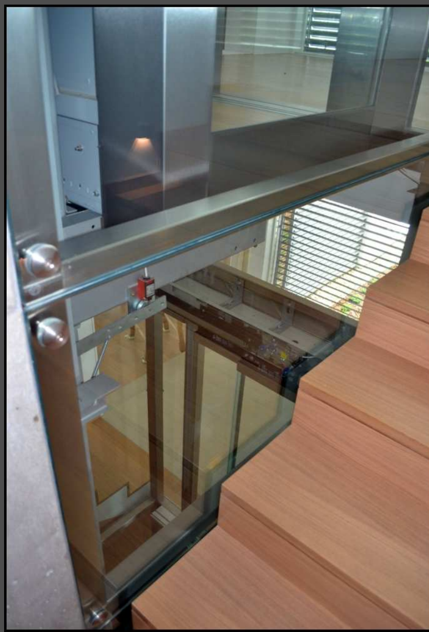
Budapest. II. Rézsű utca