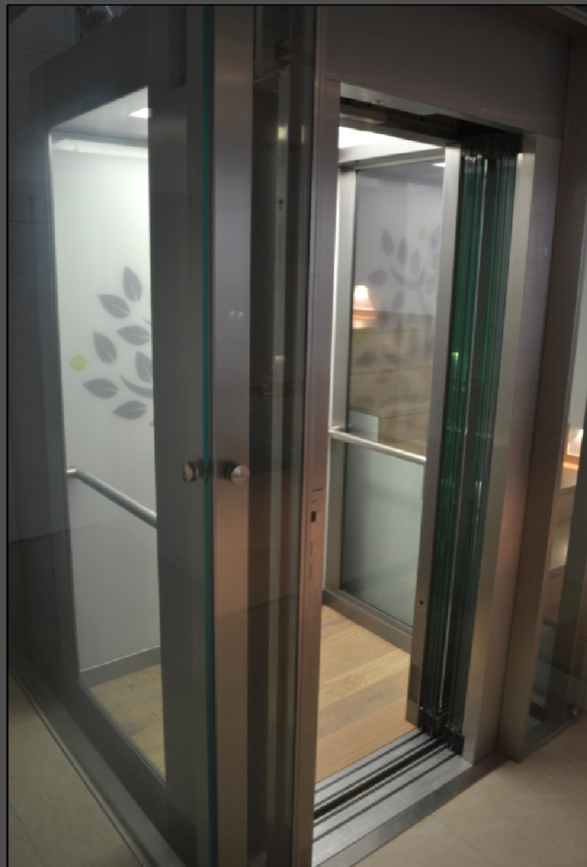
Budapest. II. Rézsű utca