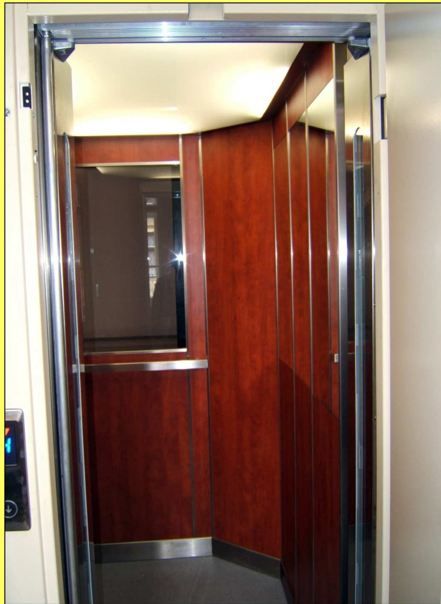
Felújítás utáni állapot